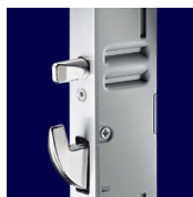
AS 4600 Штыри и крюки

При повороте ручки вверх выдвигаются крюки, штыри, цапфы. При повороте ручки вниз происходит обратное движение этих элементов. Поворотом ключа блокируется/разблокируется ручка и выдвигается/задвигается центральный ригель.