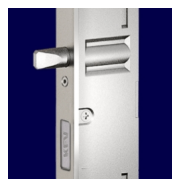
BS 2300 Штыри