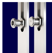
AS 4100 Комфортные противвзломные цапфы