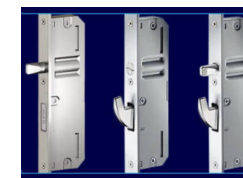
GENIUS Электромеханический замок с тремя вариантами дополнительных замков