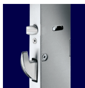
AS 2750 Фалевые защелки и крюки

При повороте ключа выдвигаются крюки, ригель, цапфы, блокируется основной замок.