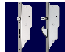
AS 3600 С механическим срабатыванием автоматики