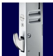
BS 2500 Крюки