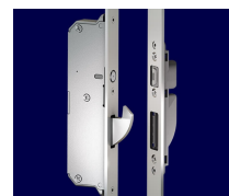
AS 3500 С магнитным датчиком выдвигения крюка

Когда дверь закрывается, магнитный датчик или механический контакт в зоне дополнительного запора приводит в действие запирающие элементы.